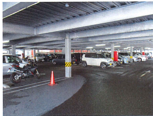
1階駐車場駐車車両の状況